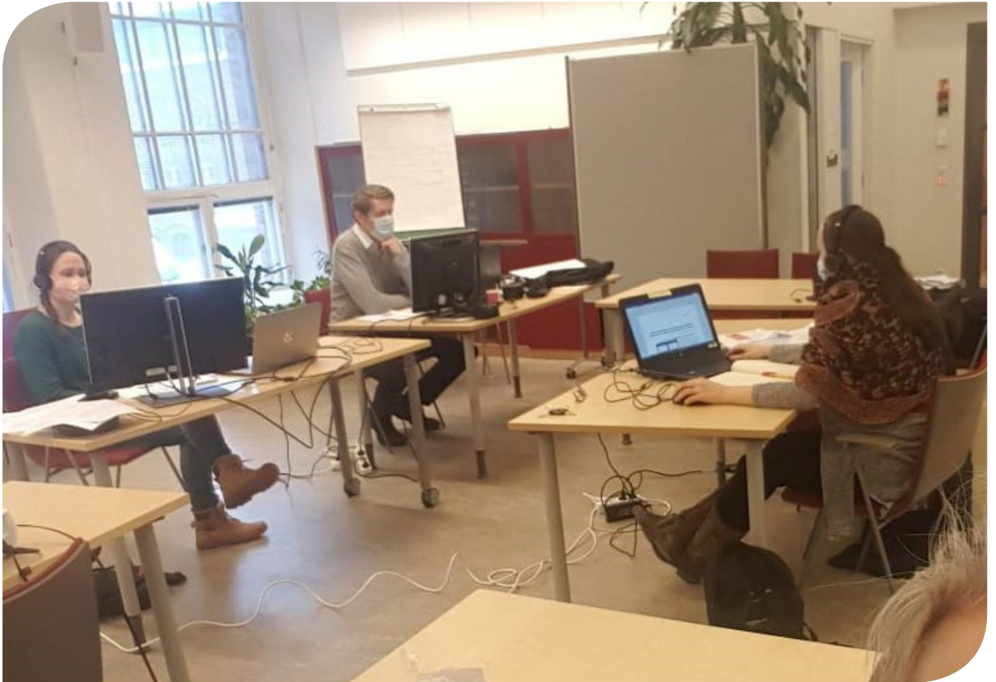
Ehdotusvaiheen asukastilaisuudet järjestettiin etäyhteyksien avulla. Kuvassa järjestäjiä Frenckellin toimistolla.